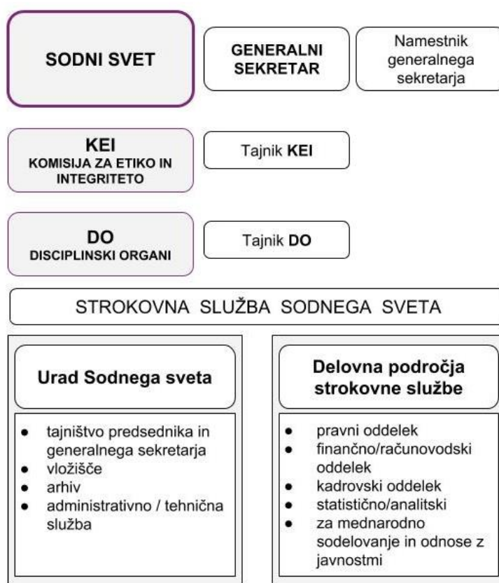
Slika 1: Organigram strokovne službe

Delo v strokovni službi v ožjem smislu je bilo v letu 2018 organizirano po posameznih delovnih področjih, in sicer na pravnem, finančno-računovodskem, kadrovskem, statistično-analitičnem področju ter na področju mednarodnega sodelovanja in odnosov z javnostmi.